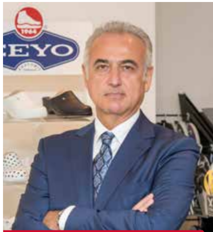
Naki Kolsuz Satış ve Pazarlamadan Sorumlu Genel Müdür Yardımcısı, Ceyo

Ceyo üst yönetimi ve Bilgi İşlem birimi, bu beklentileri karşılamak üzere Logo Tiger Enterprise uygulamasını seçti. Logo Tiger Enterprise çözümünün kapsam ve fonksiyon genişliği , devamlı eklenen yeni fonksiyonları , entegrasyon kabiliyetleri , yetkin destek hizmetleri , özellikle geliştirilebilir bir yapıya sahip olması, yasal mevzuata uygunluğu ve hızlı adaptasyonu da seçim aşamasında önemli kriterler oldu.